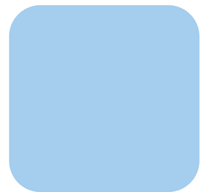
Photovoltaik- und Windenergie-Anlagen der Murphy&Spitz Green Energy in Europa. v.o.n.u. Cronheim Bahn 1,2 und 3, Deutschland; WEA Kirchengel; Solarni park Hamr, Tschechische Republik